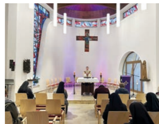
Jährlicher Gedenkgottesdienst in der Klosterkapelle auf der Eremitage in Gedenken an Louise von Marillac